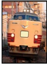
485系「つなげよう、日本。」号 (イメージ)