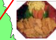
10/8 夕食 (一ノ関駅弁 イメージ)