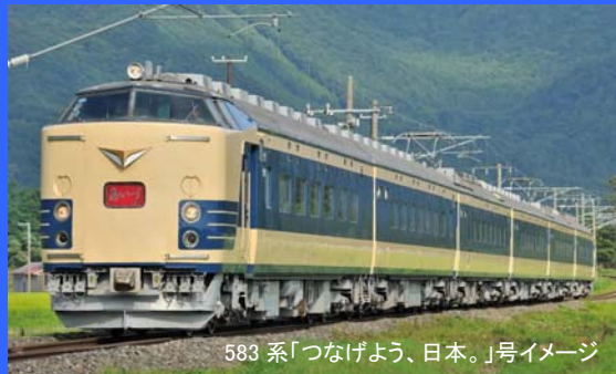
583系「つなげよう、日本。」号イメージ

ぐるり東日本周遊の旅。横浜を起点に途中、福島、仙台、盛岡を経由しながら青森へ。東京～青森まで新幹線ならば4時間ほどで結ぶ時代、14時間ほどかけて走る列車旅。青森では思い思いの時間を過ごしていただいた後、夜行列車として秋田、酒田へ。酒田からは列車を乗り継いで、さらに新潟へと列車旅は続きます。ご当地駅弁を味わいながら、途中駅でお買い物をお楽しみいただける列車旅。ぐるり東日本周遊 1550 kmの旅。