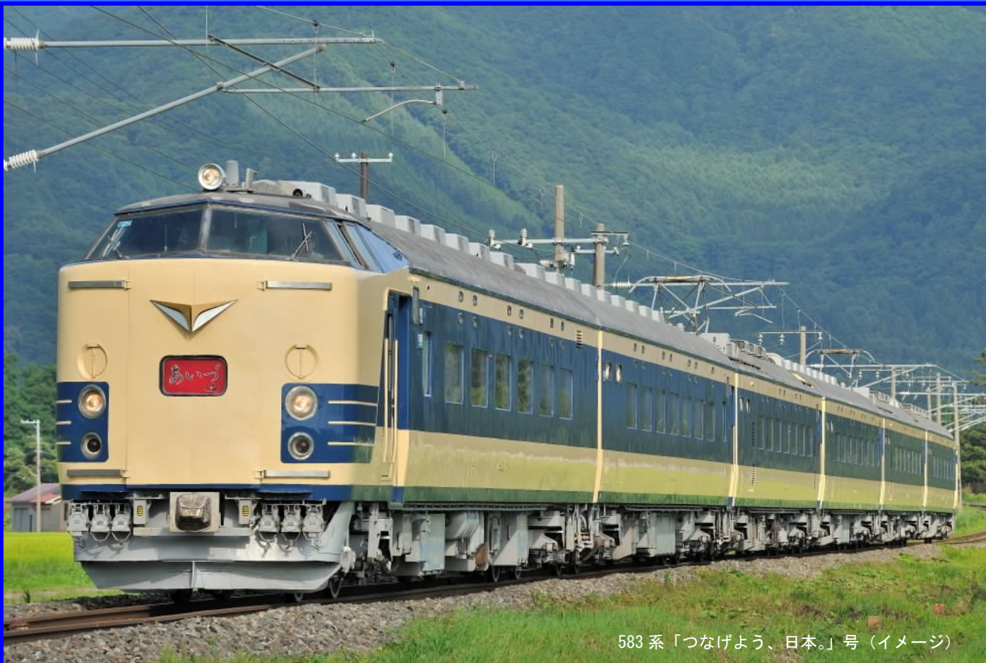
583系「つなげよう、日本。」号（イメージ）