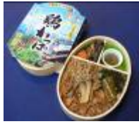
10/9 朝食(秋田駅弁)イメージ

青森駅到着時、特設デスクにてパウチャ ー券と引換えに青森銘菓「津軽」をお渡し いたします。