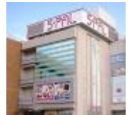
エスパル仙台店(イメージ)