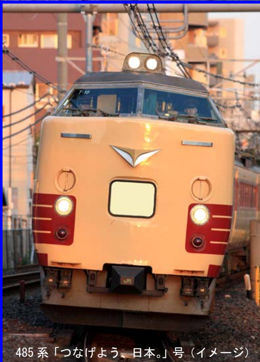
585系「つなげよう、日本。」号（イメージ）

旅で東日本を元気にしよう！ 東北各地で買物や食事をして地元貢献する旅。 今、鉄道好きなみなんでできること。 それは、元気な笑顔で東北を旅することです。 この秋みちのくを旅しよう。 つなげよう、日本。