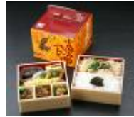
10/8 昼食 (郡山駅弁イメージ)