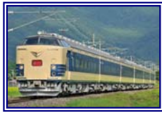
583系「つなげよう、東北。」号(イメージ)