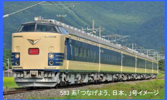
583系「つなげよう、日本。」号イメージ

ぐるり東日本周遊の旅。横浜を起点に途中、福島、仙台、盛岡を経由しながら青森へ。東京～青森まで新幹線ならば4時間ほどで結ぶ時代、14時間ほどかけて走る列車旅。青森では思い思いの時間を過ごしていただいた後、夜行列車として秋田、酒田へ。酒田からは列車を乗り継いで、さらに新潟へと列車旅は続きます。ご当地駅弁を味わいながら、途中駅でお買い物をお楽しみいただける列車旅。ぐるり東日本周遊 1550 kmの旅。